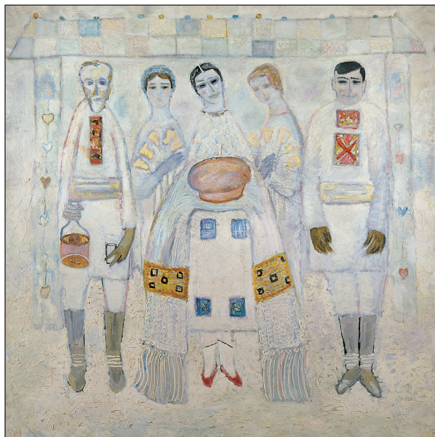
Mihail Grecu. Ospitalitate . 1965–1967, ulei pe pânză. 200 × 200 cm